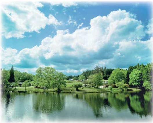
「井無田高原」山都町(理学療法士 吉本 大佑)

出典：札幌医科大学医学部 附属フロンティア医学研究所 ゲノム医科学部門 https://web.sapmed.ac.jp/canmol/coronavirus/death.html? s=y&f=y&n=j&c=1&p=1&d=0